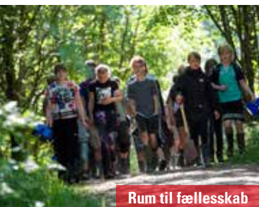
Rum til fællesskab