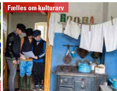
Fælles om kulturarv