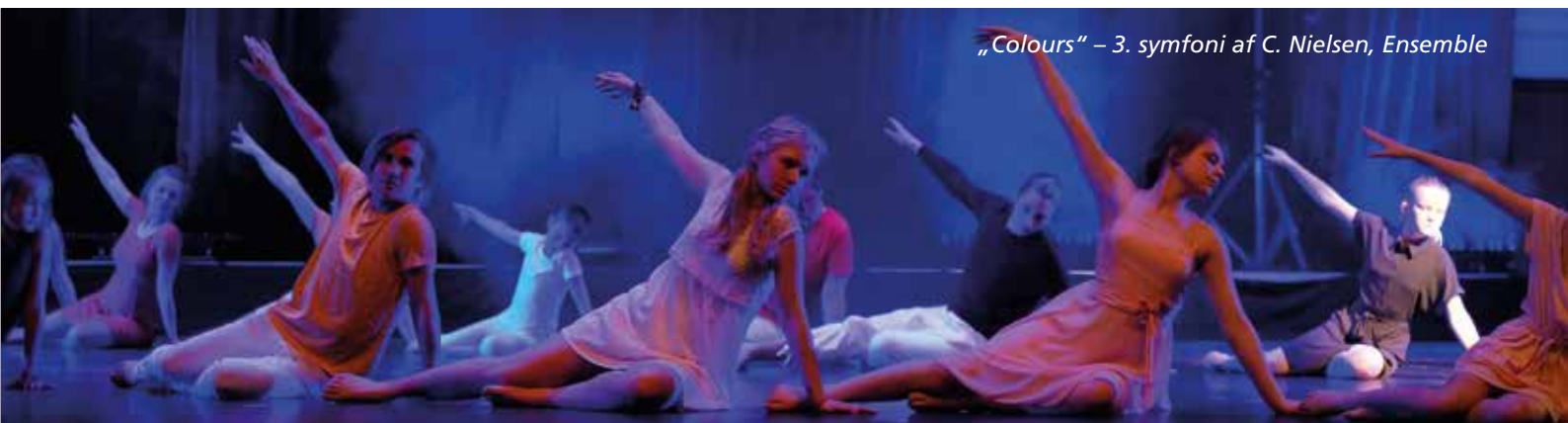
„Colours“ – 3. symfoni af C. Nielsen, Ensemble